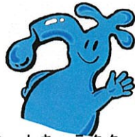
広島市水道局マスコットキャラクター じゃっくちん