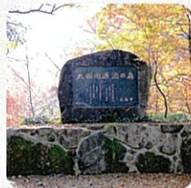
太田川源流の森石碑

太田川源流の森は、広島市が所有する水源かん養保安林で、広島県西部、冠山の位置する太田川源流域（廿日市市吉和）にあります。広島市は、この森を水源かん養機能の高いモデル水源林として整備するとともに、水源かん養の重要性について啓発する活動を行っています。