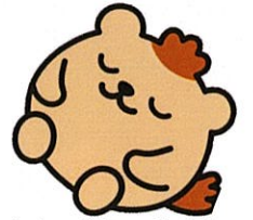
安芸太田町イメージキャラクター もりみん