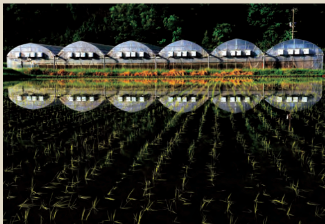
香川県小豆島町「苗の学校」