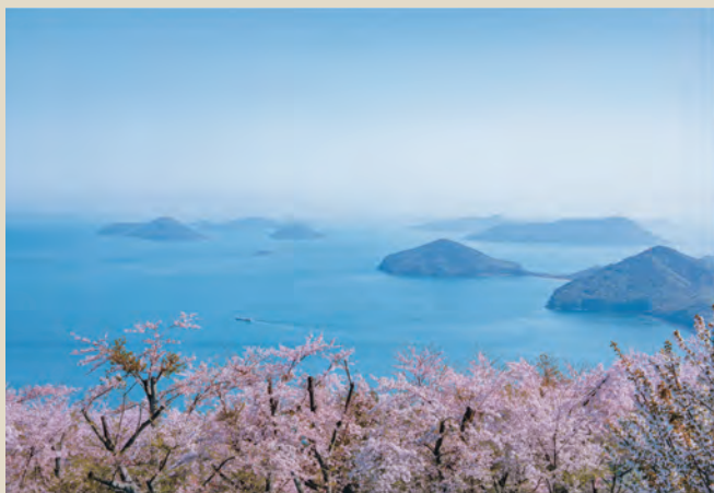
香川県三豊市「瀬戸の春景」