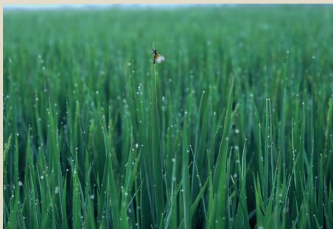
山形県山辺町「田んぼの朝」