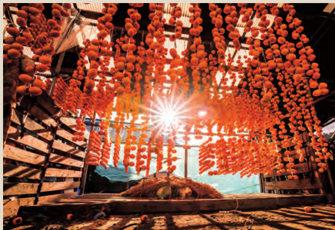
青森県南部町「里山の恵み」