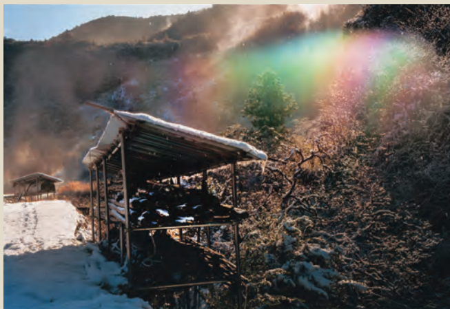
和歌山県田辺市「雪煙にレインボー」