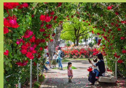
第44回 国土交通大臣賞 福山市