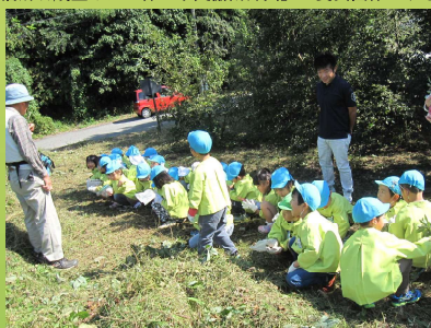
第44回 都市緑化機構会長賞 NPO法人きんたろう倶楽部

※ 活動助成金は、「緑の市民協働部門」の受賞団体のみを対象とさせていただきます。