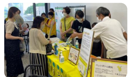
▲活動のスタートアップイベントを開催