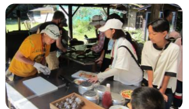
▲多世代誰もが集える居場所づくり