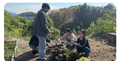
▲大学生を中心に地域の交流菜園を設置