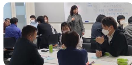
▲SDGsの視点で団体や企業等がつながるワールドカフェを開催