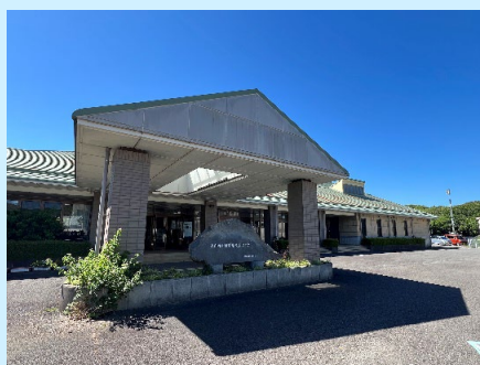
大月町農村環境改善センター