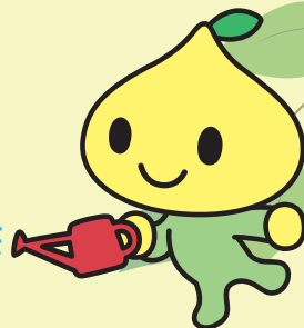
公式キャラクター ピットくん