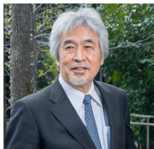
山極 寿一（やまぎわ じゅいち）

環境省自然環境局長 1989年環境庁入庁。2011年から4年間、那覇自然環境事務所長として、奄美大島、徳之島、沖縄島北部及び西表島の世界自然遺産登録に向けた地元調整に従事。その後、野生生物課長、自然環境計画課長、地域脱炭素審議官等を歴任し、2024年7月より現職。