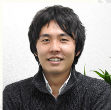
藤木 庄五郎（ふじき しょうごろう）

宮城県大崎市長 1949年9月29日生まれ。宮城県小牛田農林高等学校卒業。1987年4月に宮城県議会議員に当選（5期）。2005年7月に第33代宮城県議会議長に就任。2006年5月に大崎市長に当選し、現在5期目。在任期間中に、「化女沼」ラムサール条約湿地登録（2008年）、「大崎耕土」世界農業遺産認定（2017年）。