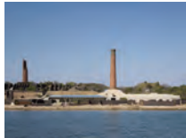
アート：柳幸典 建築：三分一博志