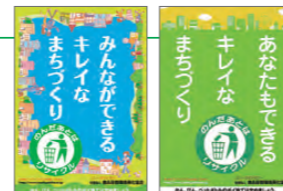
ポイ捨て防止の啓発ポスター

統一美化マーク（上記）のもと、各種媒体やメディアを通じて、散乱防止の啓発に努めています。これまで駅や社内のポスター・ステッカー、道路沿いの立看板、ポスターの掲出、バスラッピング広告など、時々の情勢に応じた方法で、散乱防止を呼びかけています。