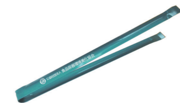
トンブ （サイズ 長さ 30cm × 幅 2.3cm）