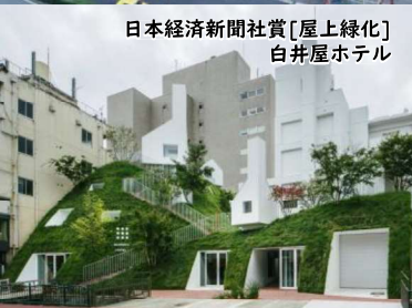
日本経済新聞社賞[屋上緑化] 白井屋ホテル