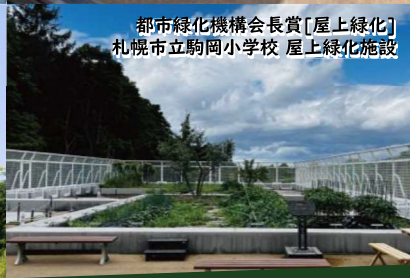
都市緑化機構会長賞[屋上緑化] 札幌市立駒岡小学校 屋上緑化施設