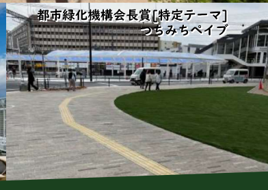
都市緑化機構会長賞[特定テーマ] つちみちペイブ