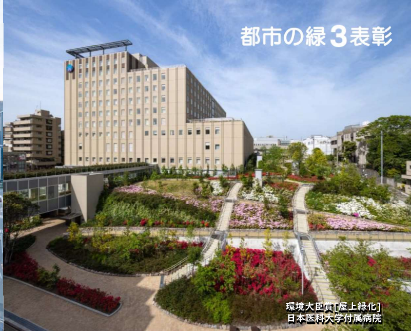
環境大臣賞[屋上緑化] 日本医科大学付属病院