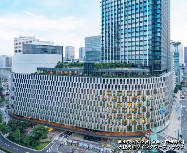
国土交通大臣賞[壁面・特殊緑化] 大阪梅田ツインタワーズ・サウス