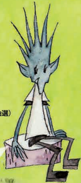
ハリネズミのハリイ

ペットボトルなんて30年前はほとんどなかったのに今は、川や海がプラスチックだらけになってしまった。「どうしてこんなことになってしまったのだろう?」この問題をいっしょに考えようよ!!