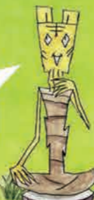
トラのトラジロー

インストラクターになると「教室プログラム」に参加できるだけでなく、各ステージの企画を実施する側になれるのじゃ