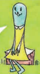
アザラシのアーシー