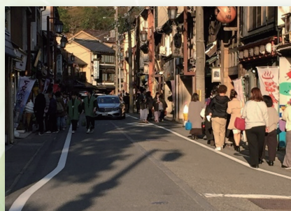
歩行空間拡大社会実験 (城崎温泉交通環境改善協議会)