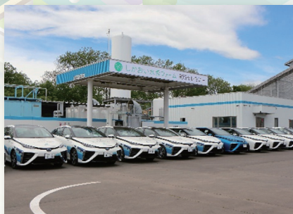
水素ステーションと水素燃料電池自動車 (鹿追町)