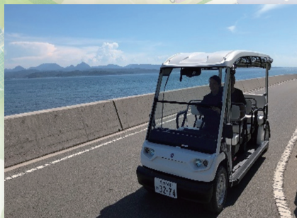
姫島の海岸線を走るグリーンスローモビリティ (T-PLAN 株式会社、一般社団法人姫島エコツーリズム)