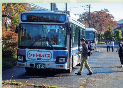
奥入瀬渓流へのアクセスはシャトルバスに乗って (奥入瀬渓流利用適正化協議会、奥入瀬渓流エコツーリズムプロジェクト実行委員会)