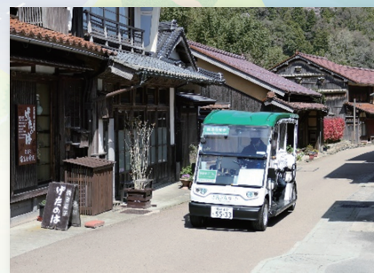
まちなみを走るカート (世界遺産石見銀山大森地区における GSM を中心とした地域内交通整備事業コンソーシアム)