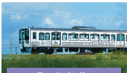
ラ・マル・ド・ボア

※旅行後のアンケート、イベント内容などのSNS発信にご協力をお願いを致します。 ※申し込み多数の場合は抽選となりますのでご了承下さい。