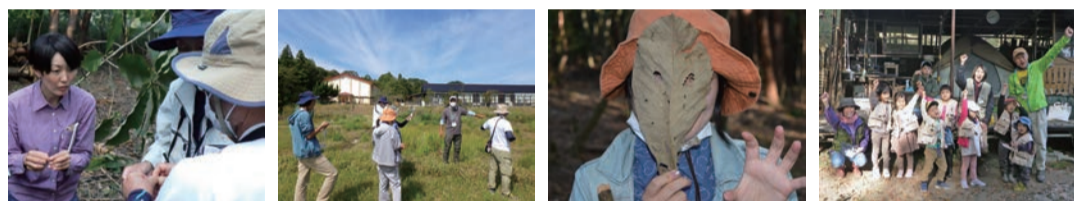
ガイド養成講座様子