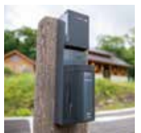
オートサイトはAC電源付き