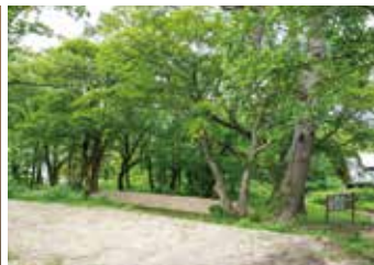
ノーマルサイトエリア