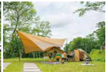
オートサイトエリア