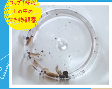
コップ1杯の 土の中の 生き物観察