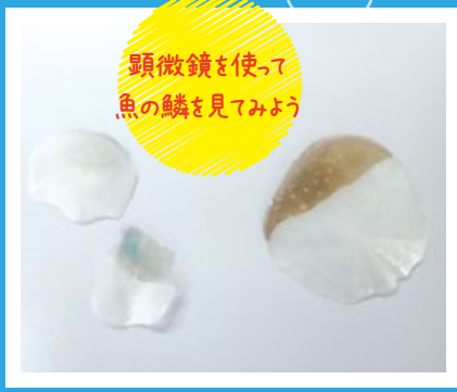
顕微鏡を使って 魚の鱗を見てみよう