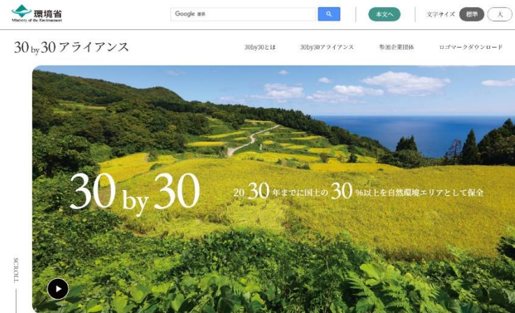
【Webサイトのイメージ】