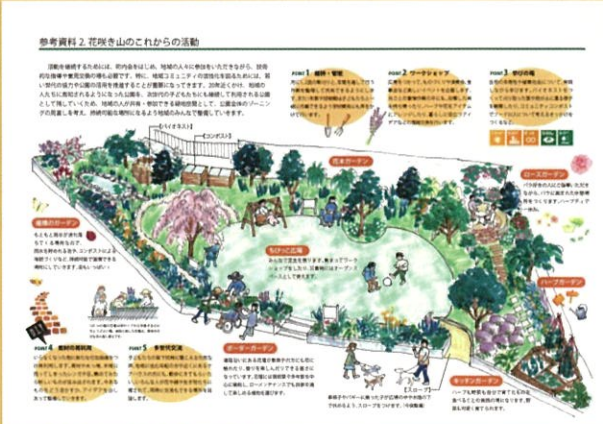
第33回 国土交通大臣賞 花咲き山

日常的な花や緑の活動を通して、地域の活性化や子どもたちへの情操教育、身近な環境の改善に寄与するプランを募集します。