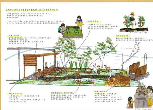
第33回 第一生命財団賞 一般社団法人異才ネットワーク