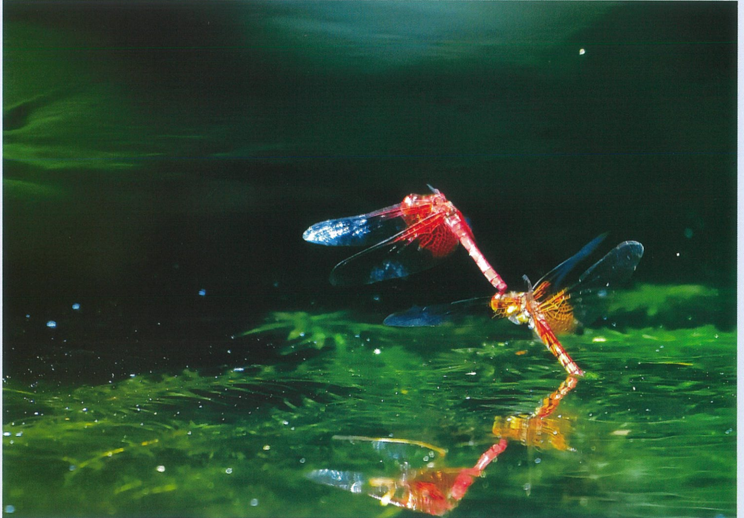
第6回 ひろしま遊学の森 四季の移ろい写真コンテスト 特選「水辺の命」