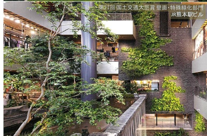
第21回 国土交通大臣賞 壁面・特殊緑化部門 JR熊本駅ビル