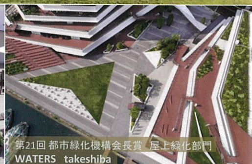
第21回 都市緑化機構会長賞 屋上緑化部門 WATERS takeshiba