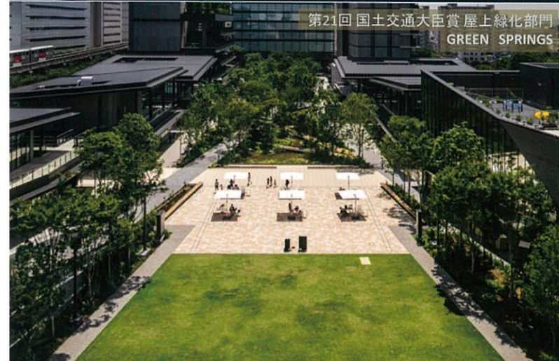
第21回 国土交通大臣賞 屋上緑化部門 GREEN SPRINGS