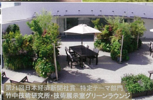
第21回 日本経済新聞社賞 特定テーマ部門 竹中技術研究所・技術展示室グリーンラウンジ