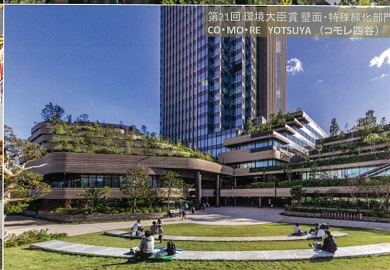
第21回 環境大臣賞 壁面・特殊緑化部門 CO・MO・RE YOTSUYA (コモレ四谷)