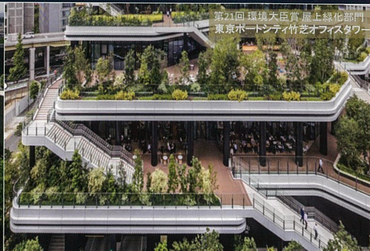
第21回 環境大臣賞 屋上緑化部門 東京ポートシティ竹芝オフィスタワー