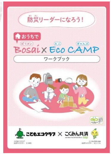
ブランケット・ワークブックはともにイメージ図