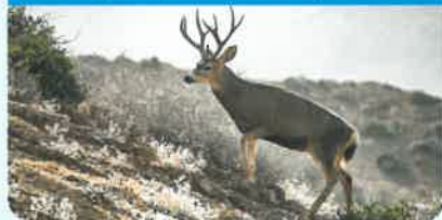
絶滅危惧生物を保護や生物多様性の保全に貢献する活動