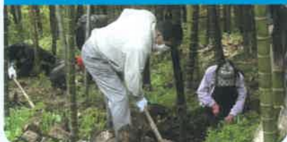
下草刈り、間伐、野焼き、河川の浄化などによる里山の維持管理活動