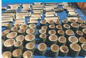
持続可能な地域づくりのための里山の特産物や自然資源を活かした活動