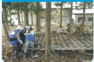
地震・大雨・津波・放射線などで被災した里山の復興活動

イオン環境財団は、1990年「お客さまを原点に平和を追求し、人間を尊重し、地域社会に貢献する」というイオンの基本理念のもと、日本で初めて、地球環境をテーマにした企業単独の財団法人として設立されました。設立以来、ひとつしかない美しい地球を次世代に引き継ぐため、世界各地で環境活動に積極的に取り組んでいる団体に対し、毎年総額1億円の助成を行っております。