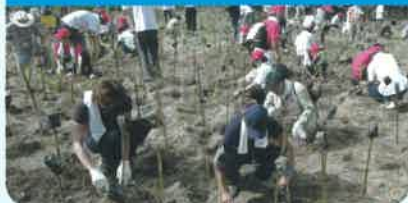
地域での植樹活動を含めた里山の修復活動