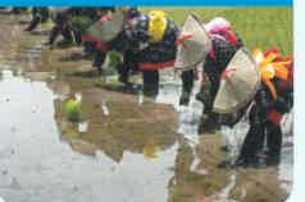
伝承・文化交流に関する活動