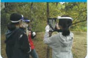
地域の子供たちや住民への環境体験・環境教育の提供