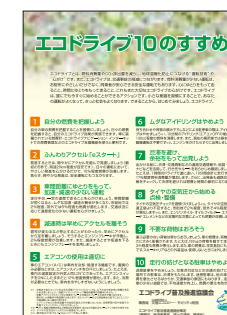
▲エコドライブ10のすすめチラシ・リーフレット (無料)