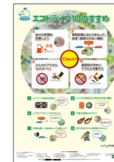
▲エコドライブ10のすすめポスター (無料)