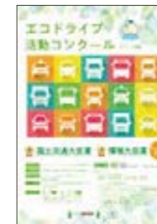
▲コンクールリーフレット (電子データのみで提供)