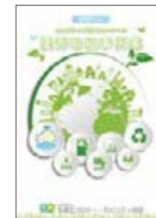
▲優秀取組事例集 (電子データのみで提供) (無料)