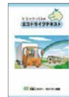
▲トラック・バスのエコドライブテキスト (200円/冊)