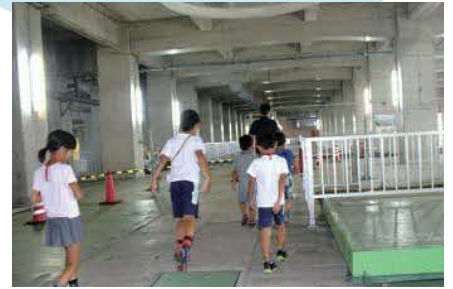
天神浄化センター