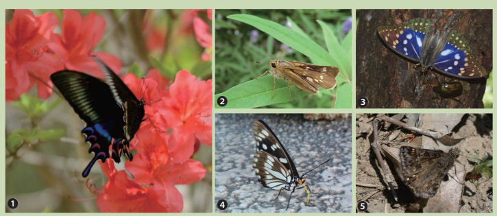
写真：減少傾向がみられた①ミヤマカラスアゲハ／②イチモンジセセリ ③オオムラサキ／④ゴマダラチョウ／⑤ミヤマセセリ

これまでの調査の報告書やニュースレターなどは、裏面記載のモニタリングサイト 1000 里地調査のWebサイトよりご覧になれます。