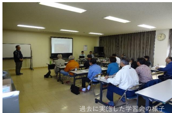
過去に実施した学習会の様子