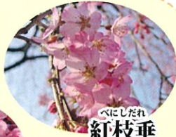
べにしだれ 紅枝垂 3月下旬 淡紅