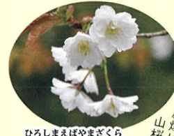
ひろしまえぼやまざくら 広島江波山桜 4月上旬 白