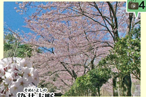
そめいよしの 染井吉野 4月上旬 淡紅

以前からある染井吉野の並木に加え、新たに多くの品種を植えました。まだまだ花は少なめですが、今後が楽しみなエリアです。