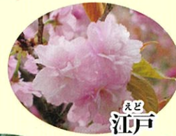
えど 江戸 4月上旬 淡紅