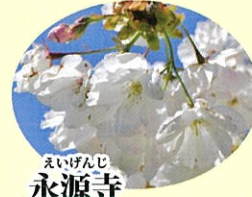
えいげんじ 永源寺 4月中旬 淡紅