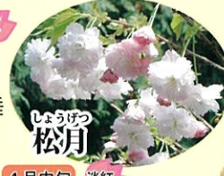
しょうげつ 松月 4月中旬 淡紅