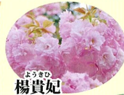
ようきひ 楊貴妃 4月中旬 淡紅