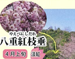
やえべにしだれ 八重紅枝垂 4月上旬 淡紅

高さ16m、枝張14mもある大きな山桜があります。満開の山桜は圧巻！ 隠れた花見スポットです。