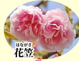
はながさ 花笠 4月中旬 淡紅

第5駐車場を囲うように13種類の桜が植栽されています。展望広場や集いの広場へ向かう道沿いの染井吉野も Good!