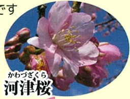
かわづきくら 河津桜 3月中旬 淡紅