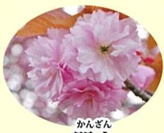
かんざん 関山 4月中旬 濃紅