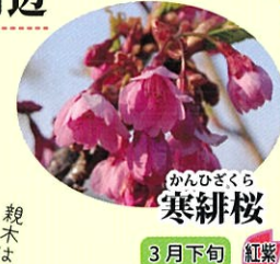
かんひざくら 寒緋桜 3月下旬 紅紫