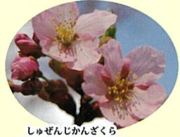
しゅぜんじかんざくら 修善寺寒桜 3月中旬 淡紅