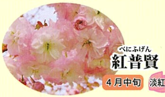
べにふげん 紅普賢 4月中旬 淡紅