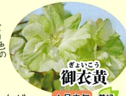
ぎょいごう 御衣黄 4月中旬 黄緑