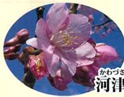
かわづきくら 河津桜 3月中旬 淡紅

あたたかいコーヒーやお食事はいかがですか？ 裏庭にもテーブルとベンチがありますので桜を見ながらお食事できます。