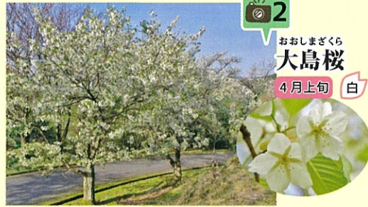
おおしまざくら 大島桜 4月上旬 白